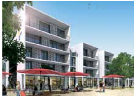
Strahlendes Weiß statt traurigem Grau: Nicht nur die Gebäudefarbe wird sich mit dem Rückbau verändern.

und Gärten in dieser Zeit gemeinhin weniger frequentiert sind. Um die Lärmbelastigung für Anwohner und arbeitende Menschen rund um den Markt so gering wie möglich zu halten, wird das derzeit modernste und schonendste Verfahren zum Rückbau des Bunkers zur Anwendung kommen, welches von Schutzmaßnahmen flankiert wird. Die Arkadenhöfe des Ende 2013 fertiggestellten Neubaus Forum Herrenhäuser