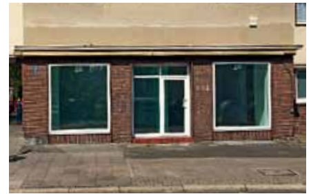
In der Herrenhäuser Straße/Ecke Münterstraße, dort wo einst das Ladengeschäft von Winzer-Optik zu finden war, eröffnet im Herbst das neue Infocenter der WGH-Herrenhausen.

Übrigens: Die nächste Ausgabe des Infomagazins erscheint Anfang September 2014 mit neuen Details. Sie erhalten alle Ausgaben auch als Download auf unserer Internetseite.